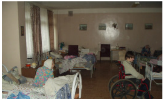
Ein Blick in ein Zimmer (bis 16 Betten – kein weiterer Aufenthaltsraum)