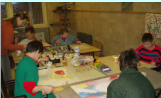
Ein Teil der Beschäftigungsangebote: Die Malwerkstatt