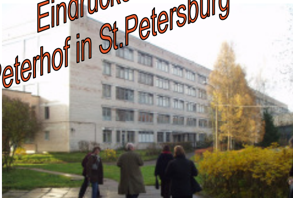
Außenansicht vom staatlichen Heim „Peterhof“ „PNI 3“ (Psycho-Neurologisches Institut)